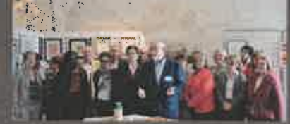
Week-end Cormery Loisirs, en juin