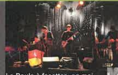
La Poule à facettes, en mai

N'hésitez donc pas à entrer dans ces lieux, à les agrémenter et à rejoindre les Cormériens qui ont déjà mis la main à la pâte.