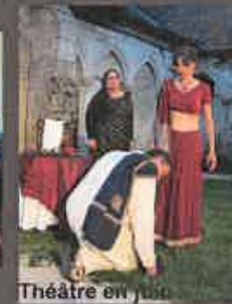
Théâtre en juin