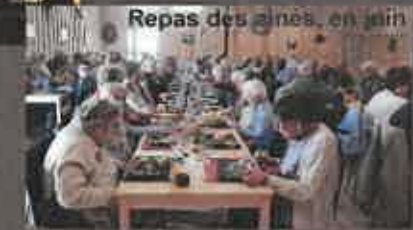
Repas des aînés, en juin