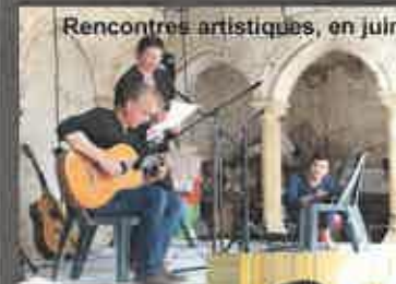
Rencontres artistiques, en juin