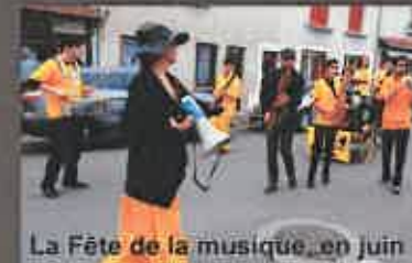
La Fête de la musique, en juin