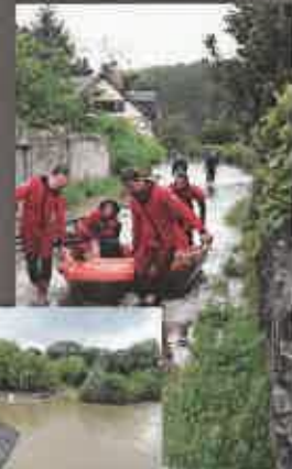
Inondations, en juin