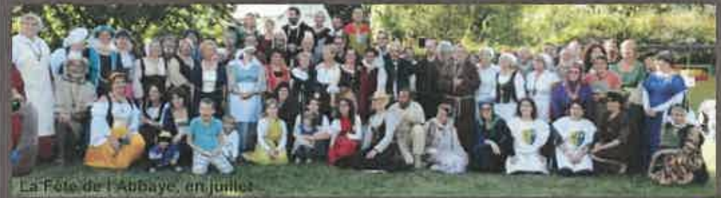
La Fête de l'Abbaye, en juillet

N'hésitez pas à faire parvenir vos photos pour agrémenter cette rétro : mairie@cormery.fr