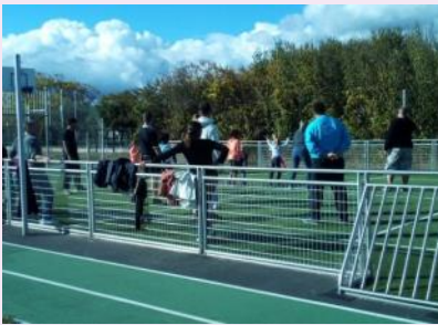
Rencontre sportive GPE 7 oct