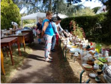
Brocante de l'Abbatiale 16 sept