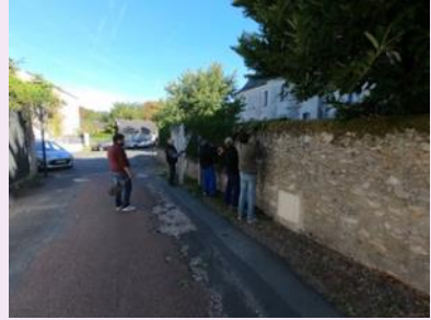
Nettoyage de l'Abbaye 29 sept