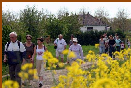
Randonnée des limites de Cormery ... il y avait près de 80 participants pour cette « ballade » menée tambour battant sur les sentiers de la commune