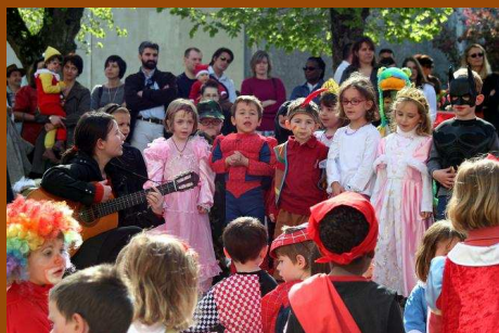
Carnaval de l'école Jacques Prévert ... le soleil était là et la cour de l'école particulièrement colorée