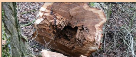
Intérieur du tronc d'un peuplier abattu

Les peupliers du camping étaient largement arrivés à maturité, certains disent qu'ils avaient une soixantaine d'années, ce qu'a confirmé le professionnel qui s'est chargé de l'abattage. Hauts de 35 à 38 mètres, le danger pour les riverains, les passants et les campeurs se devait d'être éliminé.