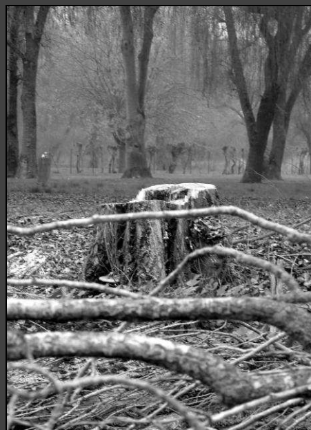
❶ ce géant était en fait devenu bien fragile – décembre 2008