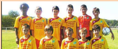
Les onze champions