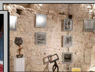
1er août, expo d'artistes