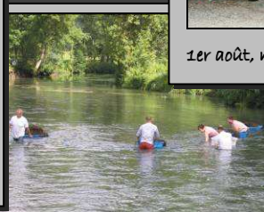
le 25 juillet, nettoyage de l'indre