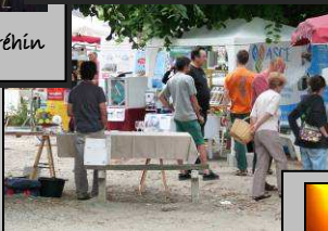
1er août, marché bio