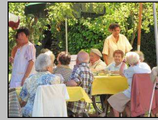
15 août, barbecue à l'Abbatiale