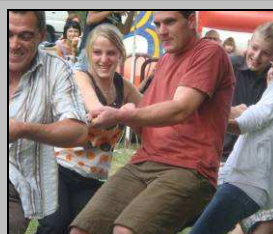
14 juillet, tir à la corde