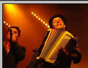
1er août, Babylon Circus