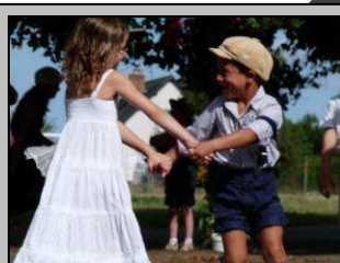
30 juillet, ambiance guinguette