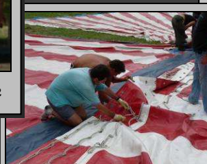
27 juillet, cormériens à l'œuvre