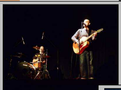
Le 19, soirée Artlequin