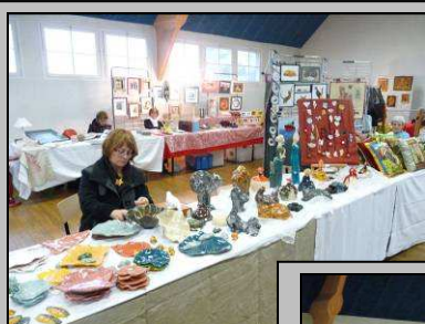
Le 14, journée artisanale

http://picasaweb.google.fr/photosCormery/