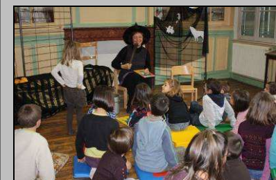
Le 17, l'heure du conte