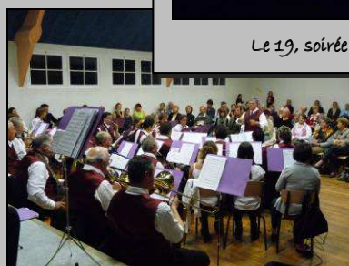
Le 6, concert de l'U.M.E