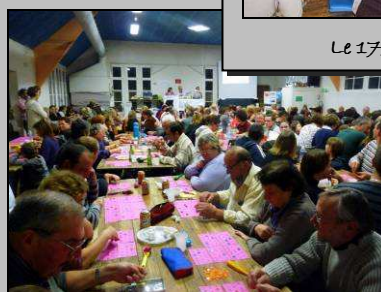
Le 20, loto du GPE