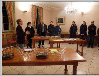
Le 14, réception des nouveaux arrivants