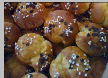
Le 17, des brioches pour le père Noël