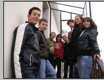
Le 22, distribution des ballotins