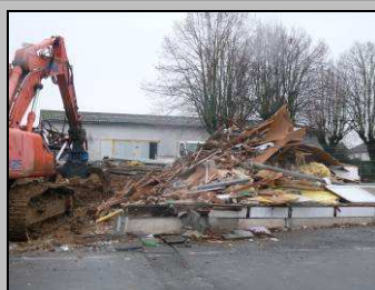
Le 21, démolition de Farandole