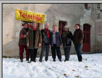
Le 3, un chèque pour le téléthon

http://picasaweb.google.fr/photosCormery/