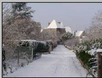
Le 3, jour de neige