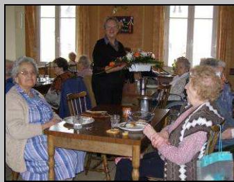
Le 21, vœux du maire aux pensionnaires de l'Abbatiale