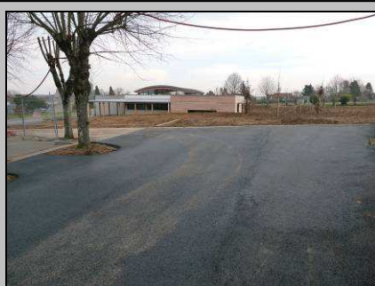
Le 17, réfection de la cour de l'école