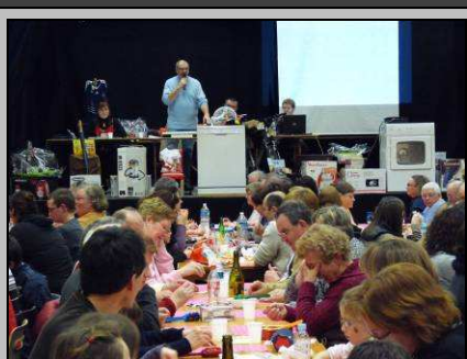
Le 12, grand loto de l'EVV

http://picasaweb.google.fr/photosCormery/