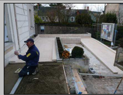
Le 17, une meilleure accessibilité à la mairie