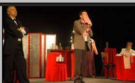
Le 19, théâtre de FCPE Alcuin