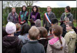
Le 18, école fleurie