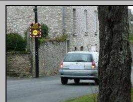
sensibilisation à la vitesse