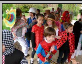
Le 26, défilé du Carnaval