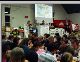
Le 19, loto du comité des fêtes