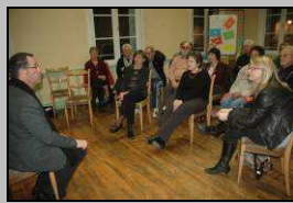
Le 22. 1000 lectures