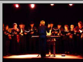
Le 27, la Truite et le Loup

http://picasaweb.google.fr/photosCormery/