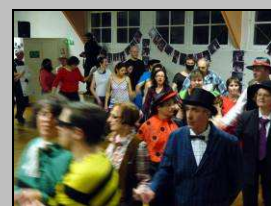
Le 5, bal de Carnaval