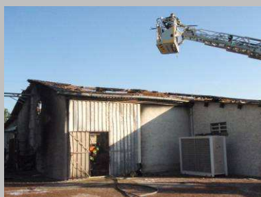
Le 30/8, incendie ravageant Gíloxal