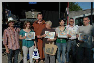
Le 2/7, Concours du Macaron