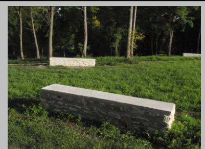
Nouveaux bancs derrière l'église