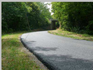
Réfection de l'enrobé route de Veneuil

http://picasaweb.google.fr/photosCormery/