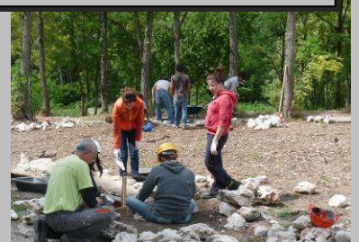
Juillet, travail des compagnons