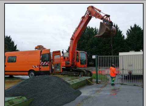
Parking pour bus dans le quartier collège