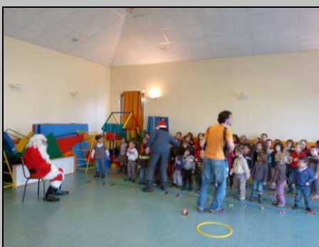
Le 16, passage du Père Noël

http://picasaweb.google.fr/photosCormery/