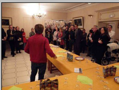
Le 13, accueil des nouveaux arrivants