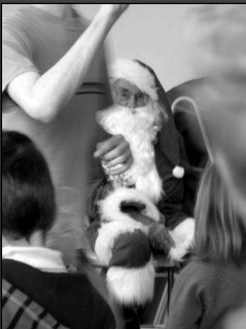
Le Père Noël à l'école maternelle, bonhomme immobile parmi l'agitation, le regard captivé, à la fois charismatique, attentif et impatient...