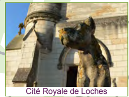
Cité Royale de Loches