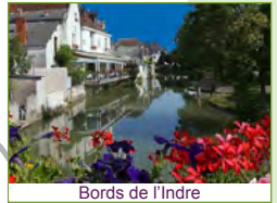
Bords de l'Indre